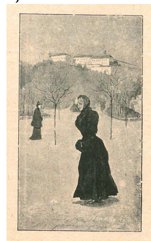
Ilustrace Artuše Scheinera k Merhautově povídce Had