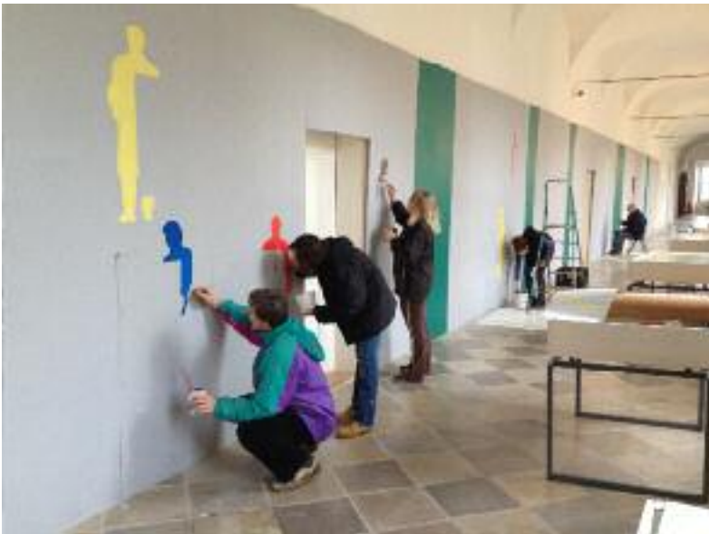
Začínáme s kresbou siluet redaktorů a redakční rady Hosta do domu