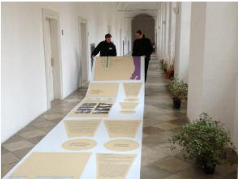
Přivezli nám texty na fóliích, už je zbývá jen vyřezat a nalepit