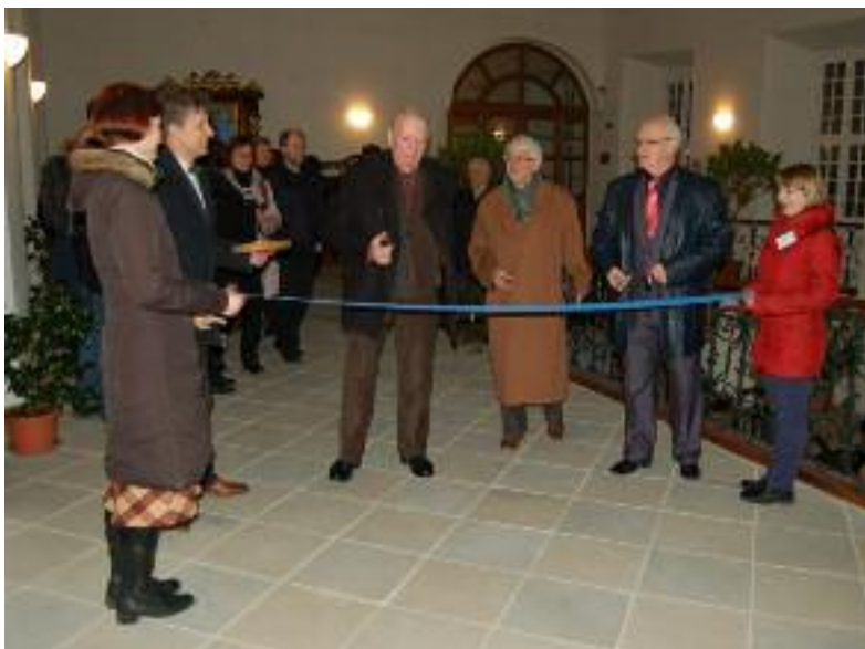
Ještě přestříhnout slavnostní pásku a výstava je otevřená...